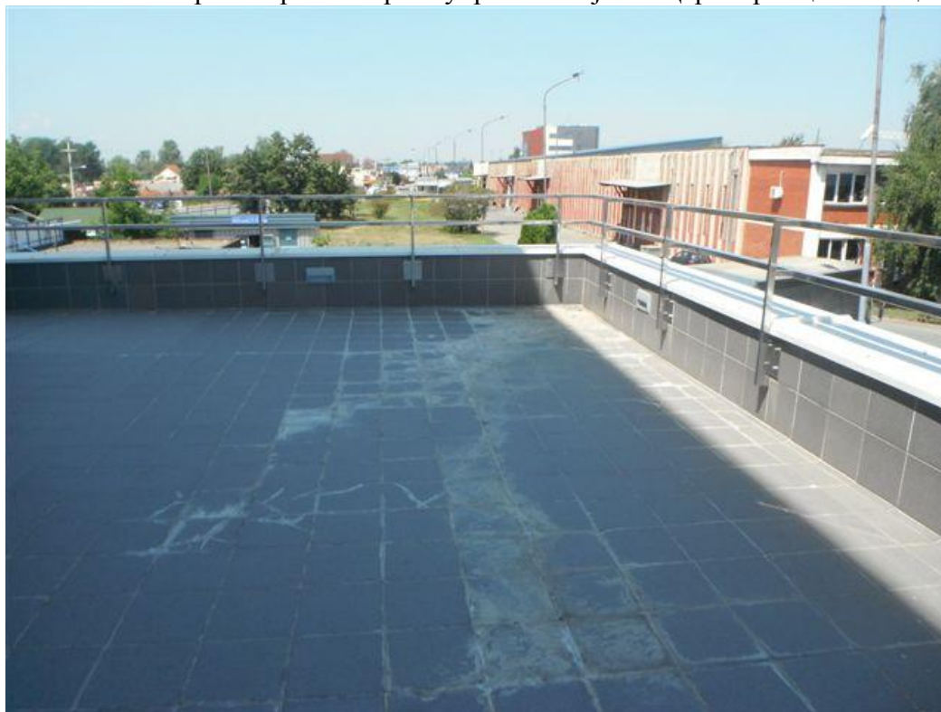
Раван кров – кровна тераса управног објекта Царинарнице Шабац

Пројектант треба да уради пројекат којим ће се решити проблем прокишњавања и санирати досадашња оштећења у објекту, настала као последица прокишњавања (молерски радови на стубовима и плафону, причвршћивање носача плафонског осветљења и др.).